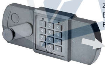
Zum Batteriewechsel Batteriefach in Pfeilrichtung aufschieben

Das Schloss wird durch eine 9 V Blockbatterie Alkaline mit Strom versorgt (keine Akkus!). Bei unzureichender Batterieladung erfolgt nach Codeeingabe mehrmals hintereinander ein Warnton und die rote LED blinkt mehrmals abwechselnd. Wechseln Sie schnellstmöglich die Batterie. Die programmierten Codes bleiben während des Batteriewechsels erhalten. Bitte entsorgen Sie gebrauchte Batterien stets umweltgerecht.