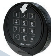
Zum Batteriewechsel Tastaturdeckel in Pfeilrichtung aufklappen