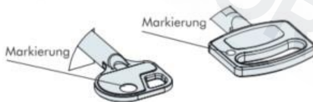
Abbildung 1 - Schlüsselmarkierung

Schlüssel so in das Schloss einführen, dass die Markierung auf der Schlüsselreide in Richtung des Schlossriegels zeigt. Das Schloss ist für rechts angeschlagene Türen ausgelegt (Drehachse rechts). Der Schlüssel muss zum Öffnen des Schlosses im Uhrzeigersinn gedreht werden. Versperrt wird das Schlüsselschloss in umgekehrter Drehrichtung.